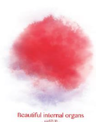
Beautiful internal organs -内臓美-