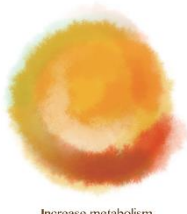
Increase metabolism -基礎代謝向上-

この内臓美 CD は、内臓の活性化、水分の代謝・排泄、重金属など毒素の排出、腸内フローラの構築を促進します。内臓機能の活性化、清浄化を目的とした複合調和音を収録しています。インナーボディのメンテナンスにお使いください。